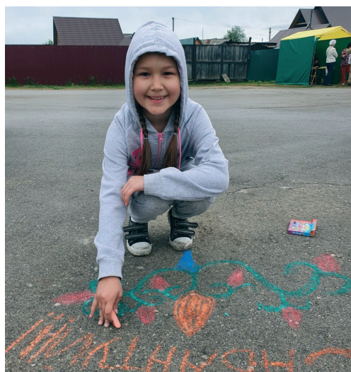
Конкурс рисунков на асфальте

11 июня Юрт-Ору в сопровождении коллег посетил губернатор Новосибир-