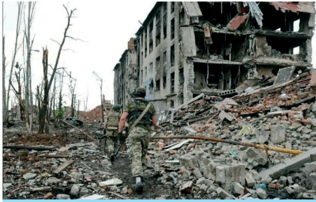
И Луганск не простит

Украинца-противника вблизи видел один раз: «Я не был в штурмовом отряде. У нас другие задачи. Пехотой нашей и боевыми товарищами горжусь. Это правда, что