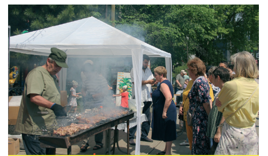
Шашлык уңышлы булды

еллыгын билгеләп үтә һәм татарлар Себер башкаласы хәзерге кебек булсын өчен барысын да эшләделәр һәм эшләвен давам ителәр.