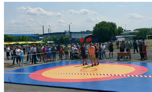
На площади спортивных состязаний

клуб «PRIDE REAL» из рабочего поселка Горный заслужили аплодисменты зрителей красивыми номерами и отличной фи-