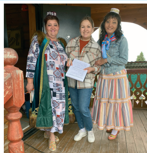
Кадры решают все

ской области Андрей Травников. Вместо запланированного часа он пробыл в деревне три. Похвалил детскую площадку, осмотрел музейную экспозицию Усадьбы чатского татарина, посетил воинский мемориал, возложил цветы к обелиску. Оценил чистоту и порядок, которым Юрт-Ора славится на всю область, поднялся на смотровую вышку. После душевного татарского чая с угощениями предложил про-