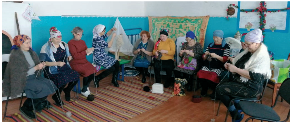
Умение вязать очень пригодилось