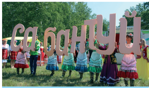
Наглядно и понятно

На нашей сибирской земле столетиями формировались добрососедские между-