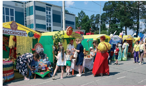
Аллея национальных подворий

Для представления культуры татар Новосибирской областной татарский культурный центр организовал большой ша-