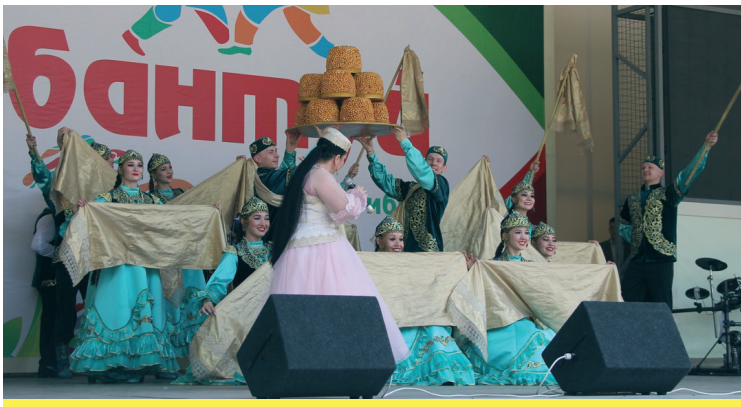
«Казан» бую ансамбле чыгыш ясыи

Казан мэриясе үзен кабат күренекле оештыручы буларак күрсәтте: барлык