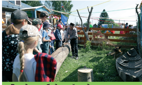
Рождение будущей лодки

можностям дошколят и школьников. Получилось отлично! Педагогика — призвание и служение, что учителя Юрт-Акбалыкской ООШ и доказали в очередной раз: все, кто побывал на детском Сабантуе в Юрт-Акбалыке, единодушно поставили празднику высший балл.