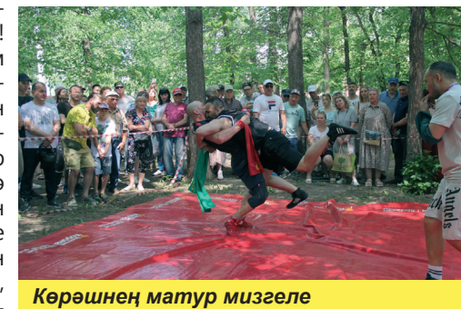
Көрәшнең матур мизгеле

Паркның үзәк өлешен зур шау-шулы ярминкә биләп алды. Сатучылар товарлары барлык тәмнәргә һәм өстенлекләргә тәкъдим ителәр. Гастрономик шедеврлар: шашлык, плов, пешкән әйберләр, туңдырма, милли киём һәм баш киеме,