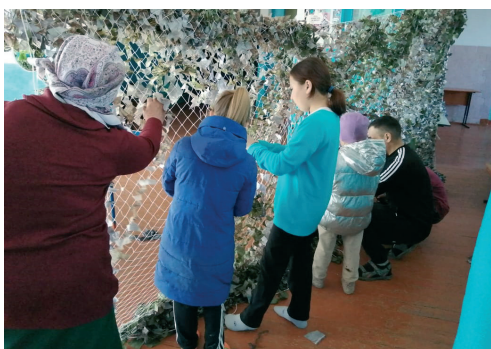
Рождение маскировочной сети

«К маскировочным сетям предъявляются особые требования. Сеть должна быть размером 6 на 3 метра, ячейки — 5 на 5 см, при изготовлении используются специальные нити, особые ткани. Сеть должна быть прочной, но легкой и укрывистой.