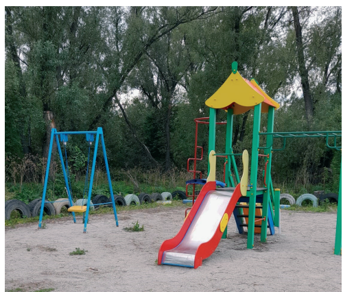
Новая детская площадка в д. Юрт-Ора

Юрт-Ора — по-татарски Умар авыл — расположена на берегу Оби примерно в 60 км от Новосибирска. Зимой там живут 42 человека — да, вот такая точность! — но с мая по ноябрь деревня принимает дорогих гостей: в теплое время года навестить бабушек, дедушек и родные места приезжают из города молодые семьи с детьми.