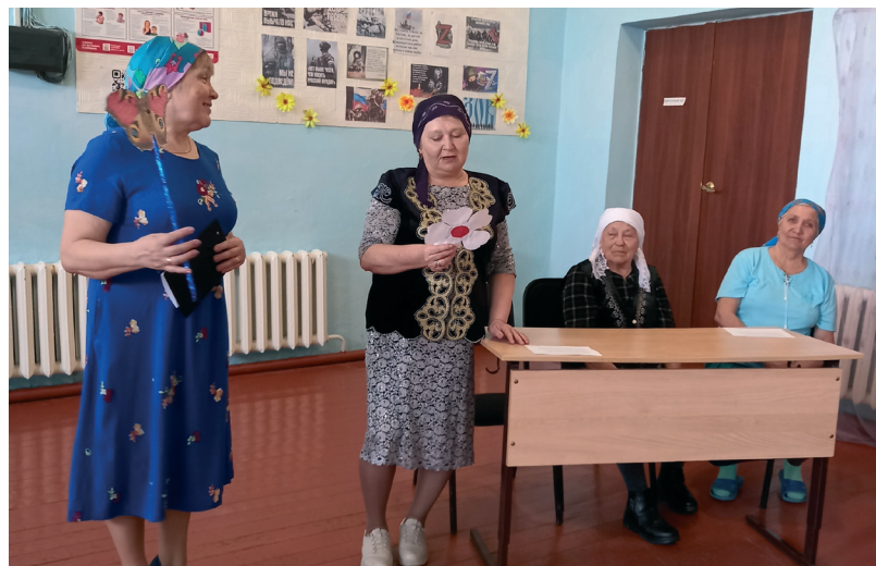
Звучат стихи Тукая

лась. Огромное спасибо вам, мои дорогие односельчанки и единомышленницы, за отзывчивость, поддержку, энтузиазм! Вы вдох-