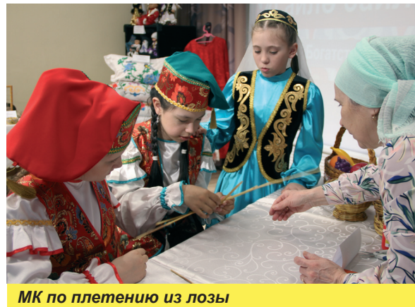
МК по плетению из лозы

смекалка, азарт, юмор и умение достойно соревноваться. В этапах: визитка, творческий, кулинарный, спортивный, интеллектуальный («ЭТНО-блеф» — настоящая