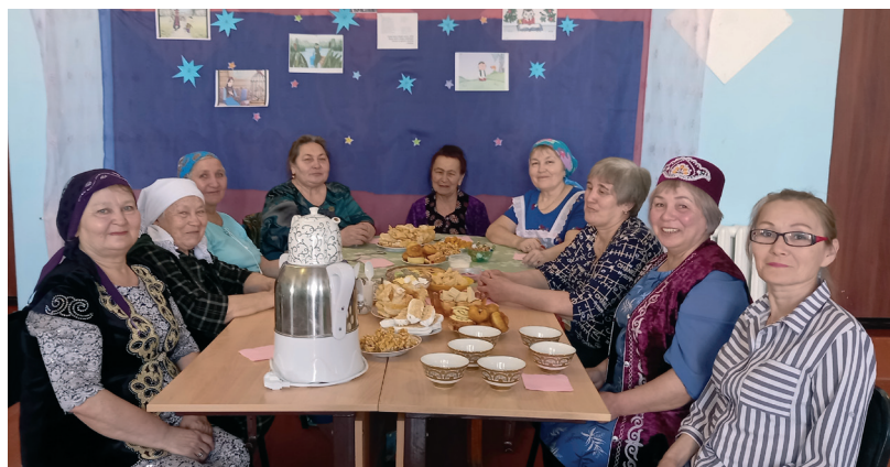
Вкус к жизни

Я руковожу татарским женским клубом «Ак калфак» в Аулкошкульском СДК. Работа очень нравится, потому что вокруг меня собрались замечательные активные женщины. 31 марта я провела конкурс «Татар авыл хатыны», целью которого было показать, какой должна быть истинная татарка. А апрель у нас отмечали вечером поэзии.