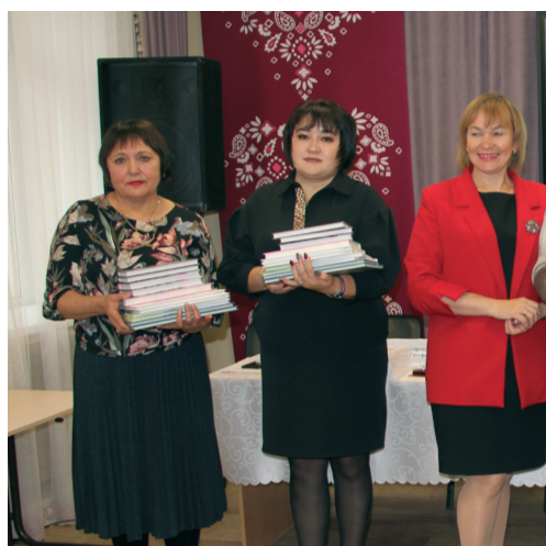
Дәреслекләр — Казан бүләге

Семинар-киңәшмәдә катнашучылар туган тел дәресләреннән баш тартуның беренче сәбәпләрен ачыклады: укытучыларның булмавы яки аларның артык күп мәшгульеге, педагогларның өстәмә сәгәтләрдән баш тартуы; төп фәннәр буенча мәгълүматның зур күләме аркасында ата-аналарның балаларны мәҗбүри булмаган дәресләр белән йөкләргә теләмәве. Нәтиҗәдә, мәктәпләр