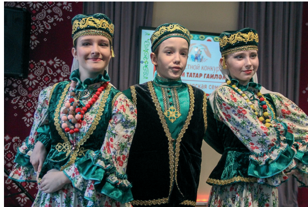
Танцуют «Звёзды галактики»

Думаю, когда Год семьи будет завершен и президент обозначит новый ориентир, фокус нашего интереса и внимания к семьям уже не сместится. Хочется, чтобы в Доме татарской культуры горожане и гости всех возрастов и национальностей чувствовали себя уютно, в наших стенах всегда было весело и интересно — и места достаточно».