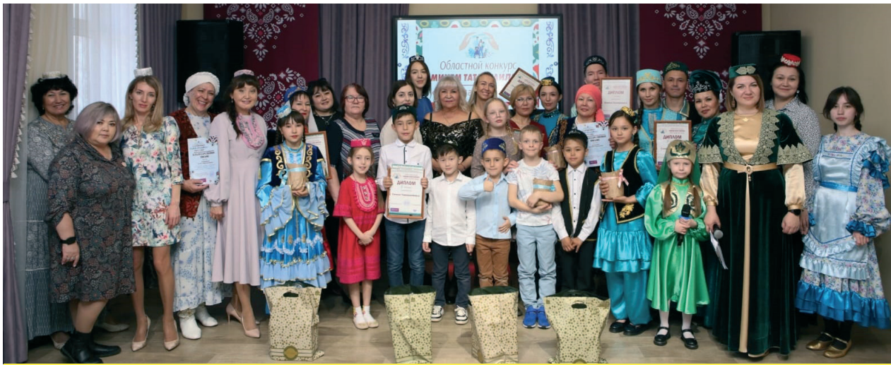
Мы действительно семья!

Татар Автономиясе советы, татар мәдәни үзәге коллективы һәм «Новосибирск татарлары» гәҗитне редакциясе