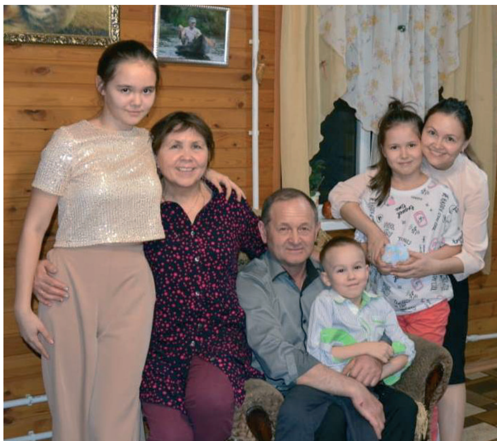
С супругой, дочерью и внуками

Когда в середине 2000-х окончательно пропала надежда, что кто-то со стороны придет нам хорошую жизнь наладить, люди постепенно вернулись к мысли, что нужно, как встарь, кормиться самим. Сейчас у большинства есть подсобные хозяйства, трактора, техника, в Юрт-Акбалыке табун лошадей большой. Посторонние удивляются: крепко живете!