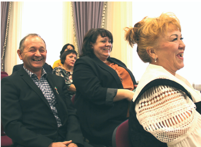
С коллегами на семинаре

Что я гораздо больше времени на работе и в работе, чем дома, мои все привыкли давно. Жена, фактически, сама на круглосуточном дежурстве, она в сельской амбулатории работает. Вот недавно один пострадал, ноги снегоходом перебило, так пока скорая приехала, она от него не ото-