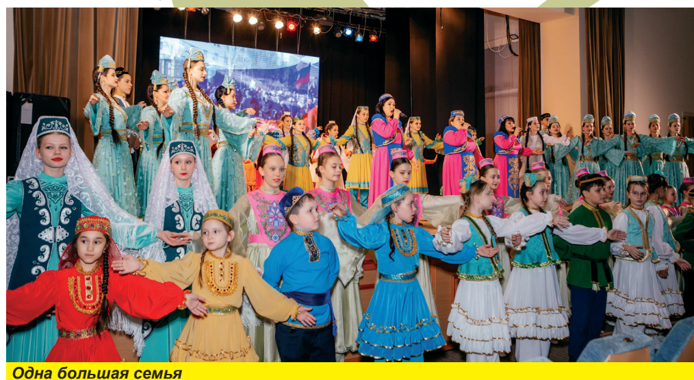
Одна большая семья

— Ребятишки с дошкольного и младшего школьного возраста начинают танцевать классический танец в театре танца «Грезы», это обязательная программа, позже осваивают татарские танцы в «Салават купере». Любый народный танец состоит из движений, требующих много энергии, и костюмы тяжелые, к народному танцу нужно накопить базу. На «Себер Йолдызлары» я привезла 20 человек старшую группу, 9-10 класс, танцоры опытные, понимающие, о чем они танцуют. У нас в репертуаре много сюжетных татарских танцев, один из них, «Каз өмәсе», ребята исполнили на Гала-концерте. Гусей, с которыми танцевали девочки, мы шили сами, закупать реквизит финансирование не позволяет. Мы в 2023 году упустили ваш фестиваль, поэтому нынче я его караулила, ждала. В Новосибирске такой доброжелательный зритель, нам очень нравится ездить к вам, первый раз мы были на «Себер Йолдызлары» в 2007 году, стараемся участвовать постоянно. Принимающая сторона, организаторы — спасибо вам большое! Так нравится рациональное выстраивание программы! Режиссер все делает заранее, всех вовремя оповещают, дают программу. Я сама безумно ценю время как человек пунктуальный, и могу сказать, что на «Себер Йолдызлары» стало доброй традицией проводить все по минутам. Нет задержек вообще, остается только догадываться, как вам удалось достичь такой