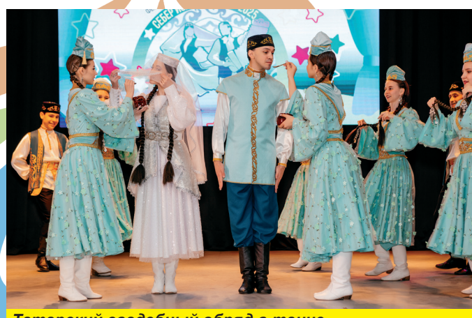
Татарский свадебный обряд в танце

вые принял участие в мероприятии такого уровня как XIII Межрегиональный фестиваль-конкурс татарской культуры «Себер Йолдызлары». Это было очень ответственно, потому что мы — непрофессиональные вокалисты, как умеем, поем татарские песни, которые слышали от мам и бабушек. Это большое событие, фестиваль, стало для нас не только возможностью продемонстрировать свои скромные таланты, но и настоящим праздником