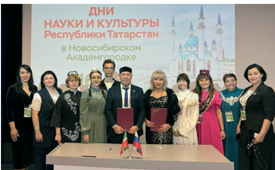
Казан дәүләт мәдәният институты һәм Новосибирск өлкәсенең татар мәдәнияте үзәге арасында хезмәттәшлек турында килешү төзегәннән соң

Рәсми өлештән соң Татарстанның һәм Себернең әйдәп баручы галимнәре катнашында фәнни сессия башланды. Өч көн эчендә фәннең төрле өлкәләреннән актуаль булган проблемалар күтәрелде һәм чишү юллары эзләнде. Шулай ук Татарстан Республикасының фән һәм мәдәният көннәре кысаларында митинг һәм академик М.А. Лаврентьев һайкале янында чәчәкләр салу булды. М.А. Лаврентьев Казанда туган һәм укыган. Һәм ул Новосибирск шәһәрәндәге Академгородокка нигез салучы булып тора. Ә быел аның тууына инде 125 ел тула.