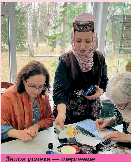
Залог успеха — терпение